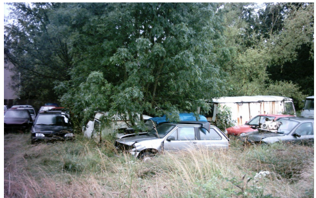
Illustration 1: Dépôt sauvage de véhicules hors d'usage

La lutte contre les sites illégaux d'élimination de déchets constitue une part importante des inspections conduites en 2014.